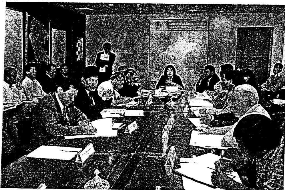
A LA DERECHA REPRESENTANTES DE GTCI, DEP Y OSINERG ATRÁS TGP, MUNICIPALIDAD DE LA CONVENCION, DGAAE Y PRENSA DEL MEM.