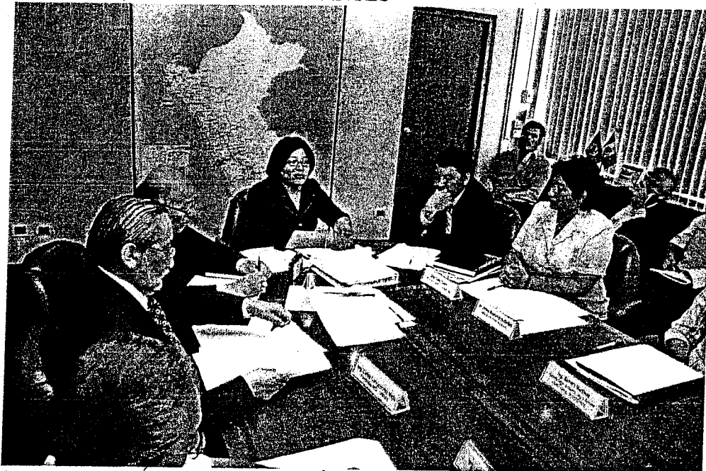
INTRODUCCIÓN A LA REUNIÓN