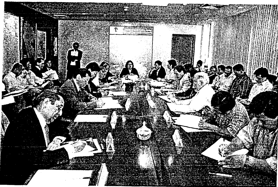
ANTECEDENTES Y TEMAS DE AGENDA