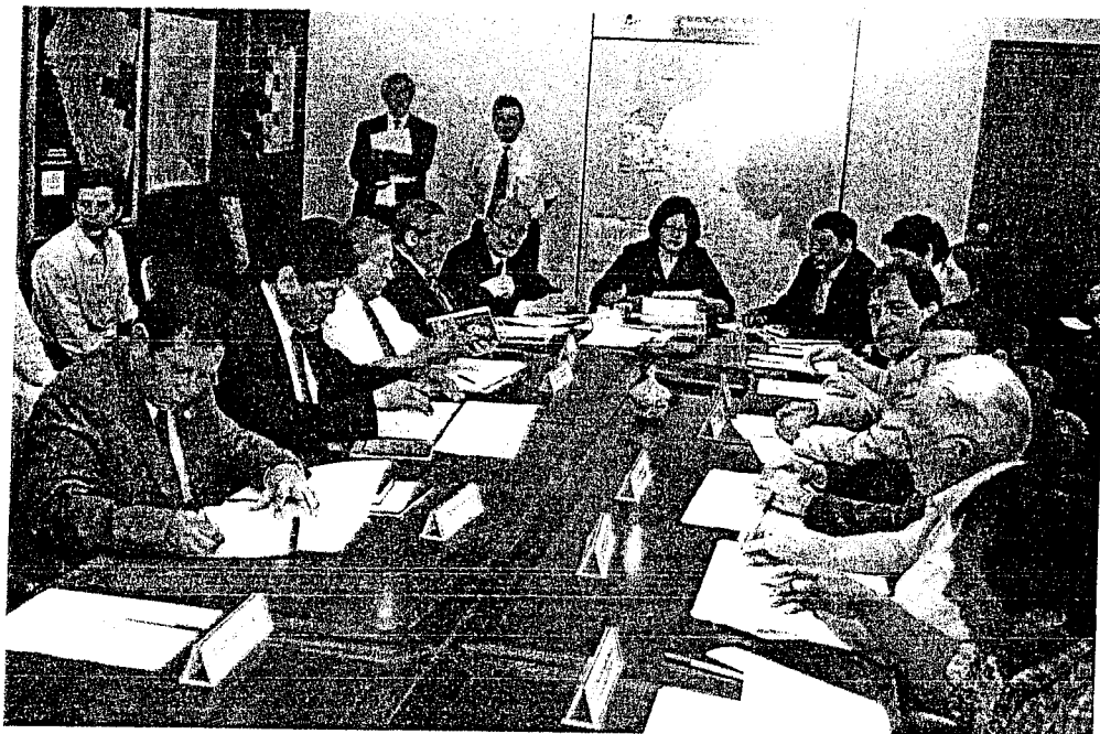
PRESENTACIÓN DE PARTICIPANTES