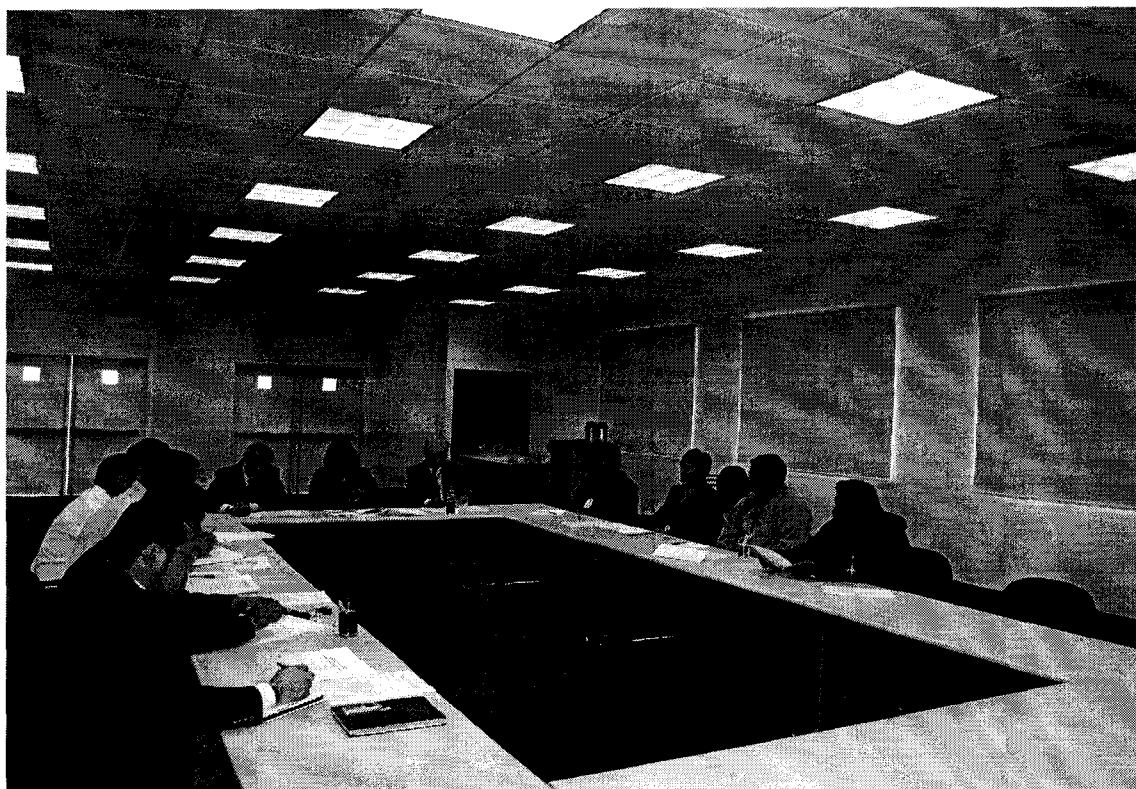
Tercera Reunión Bimensual entre, El Estado MEM, OSINERG, Comunidades Nativas del Bajo Urubamba CECONAMA, COMARU, y las Empresas TGP, Pluspetrol y CONAP Llevada a cabo el día 13 de octubre de 2005, en el City Gate de TGP – Lurín –Lima.