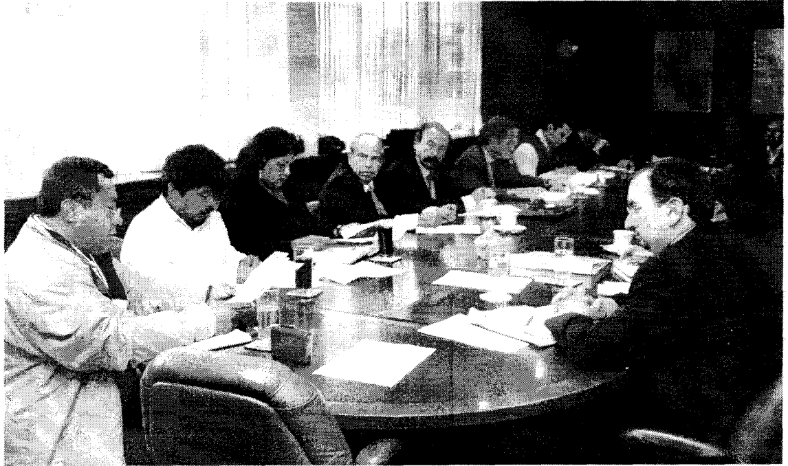
Primera Reunión Bimensual entre, El Estado MEM, OSINERG, Comunidades Nativas del Bajo Urubamba CECONAMA, COMARU, FECONAYY y las Empresas TGP, Pluspetrol Llevada a cabo el día 06 de junio de 2004, en el Ministerio de Energía y Minas