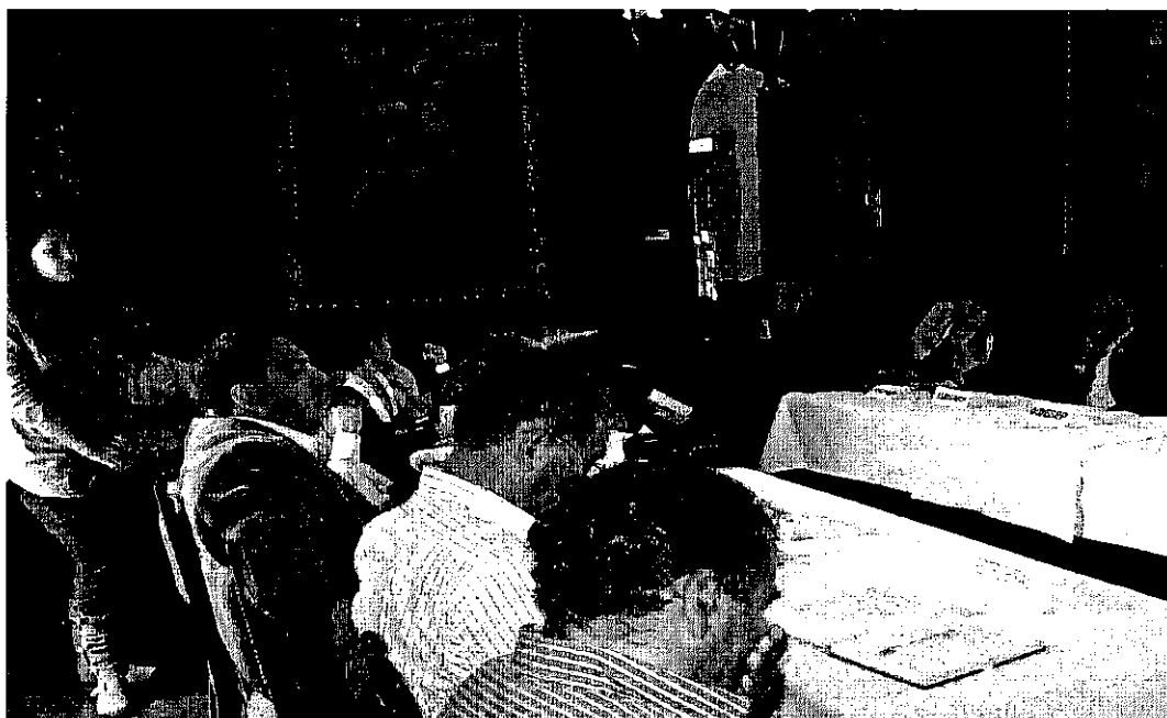
XIV Reunión Trimestral entre, el Estado Comunidades del Bajo Urubamba y Empresas (TGP, PLUSPETROL, REPSOL y PETROBRAS)

Llevada a cabo el día 13 de noviembre de 2012, en el Hotel Casa Andina Private Collection Cusco, Salón Rojo , Plazoleta Limacpampa Chico 473- Cusco