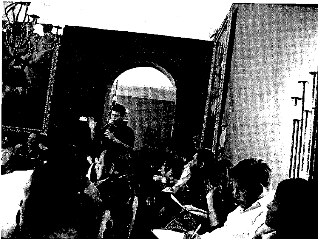
Representantes de las empresas, organizaciones, instituciones