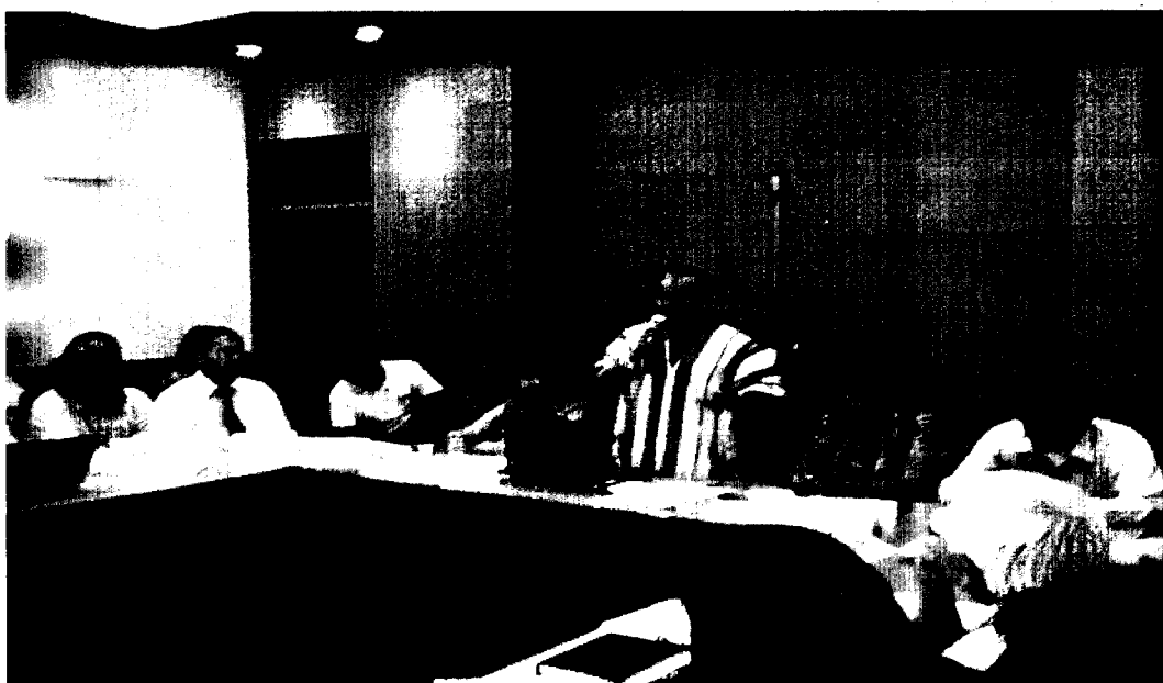
Presidente del Comité de Gestión del Bajo Urubamba, Directora General de Asuntos Ambientales Energéticos del Ministerio de Energía y Minas

Llevada a cabo el día 13 de febrero de 2013, en el Hotel NOVOTEL, Av. Víctor Belaúnde N° 198, San Isidro-Lima