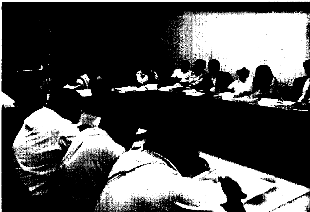
XV Reunión Trimestral entre, el Estado Comunidades del Bajo Urubamba y Empresas (TGP, PLUSPETROL, REPSOL y PETROBRAS)

Llevada a cabo el día 13 de febrero de 2013, en el Hotel NOVOTEL, Av. Víctor Belaúnde N° 198, San Isidro-Lima