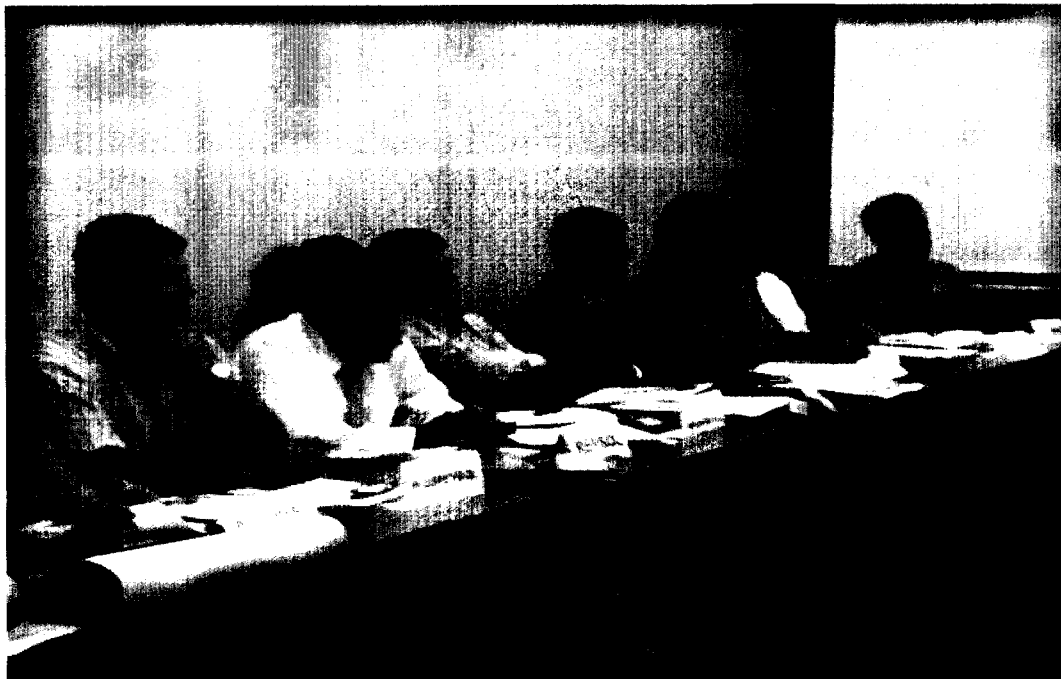
Representantes de las empresas, organizaciones, instituciones