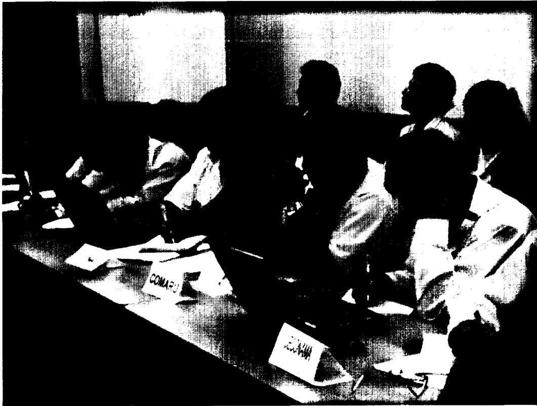
Representantes de Federaciones, organizaciones