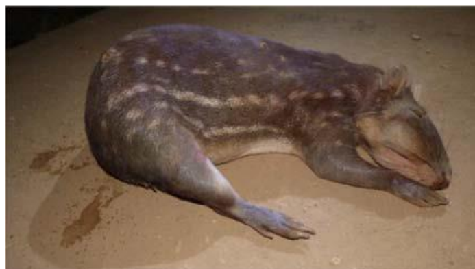
Fotografía 4-12. Majas Animal de caza -- Cuniculus paca