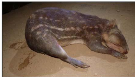
Fotografía 2-11. Majas Animal de Caza -- Cuniculus paca

Respuesta del Titular: Se verificó la observación realizada por la autoridad en el documento y se realizaron los ajustes sugeridos según se muestra a continuación: