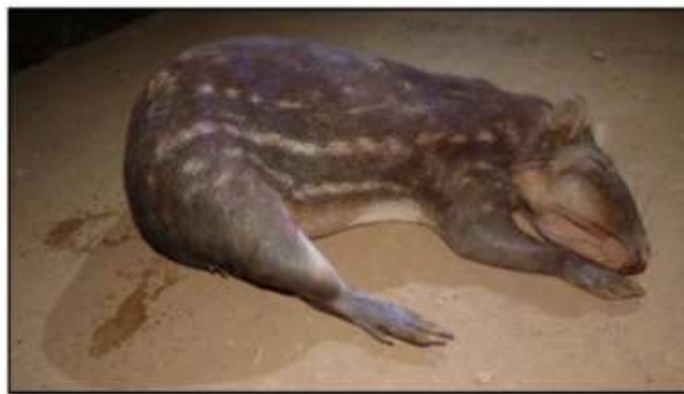
Fotografía 1. (Fotografía 4-13). Majas, Animal de Caza – Cuniculus paca

La Fotografía 2-11 ha sido corregida en la versión anterior del presente informe de Levantamiento de Observaciones y la Fotografía 3-29 no presenta errores.