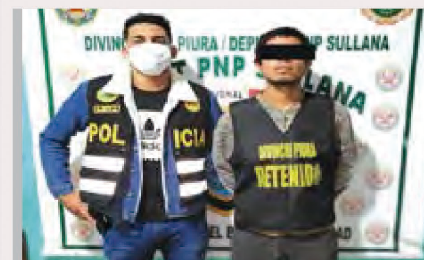
POLICÍA LO CAPTURA.

Según informaron vecinos de la zona oeste de Sullana, la ribera del río es usada a diario por personas adictas a la droga por lo que solicitaron a las autoridades policiales que estos operativos no solo sean de un día sino de manera permanente. ■