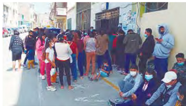
PERSONAS SE AGLOMERAN EXPONIÉNDOSE AL CONTAGIO.