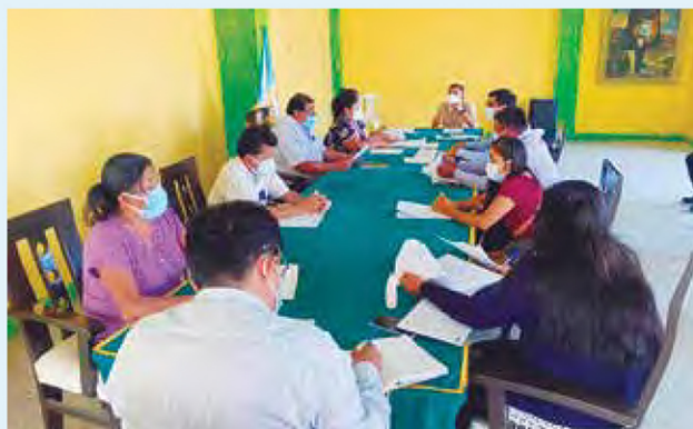
PLENO DE CONCEJO APROBÓ INICIATIVA.

Después de recibir la debida capacitación, tendrán la facultad de aplicar sanciones como la F1 en el caso de los buses o combis como lo establece la Ordenanza Provincial