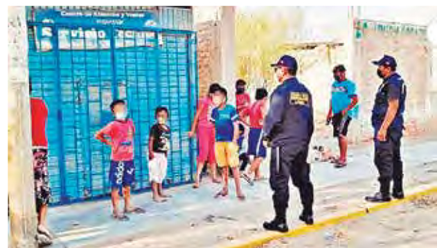
SERENOS SE APERSONARON AL LUGAR DEL ROBO.

a tener actas provinciales para sancionar con este tipo de multas. Se espera que se emita la resolución respectiva de parte de la provincial. Según el convenio, al menos 10 inspectores serán homologados para ejecutar este convenio interinstitucional. ■