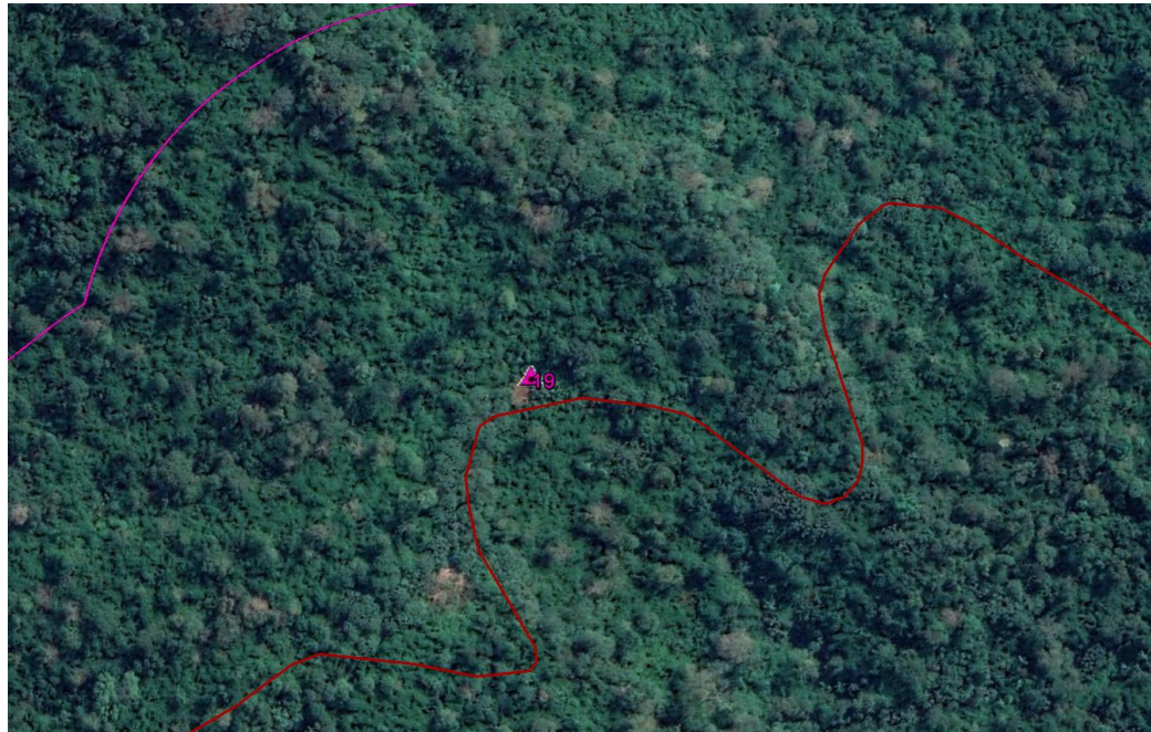
Figura 02 Puntos de acopio sobre cobertura boscosa