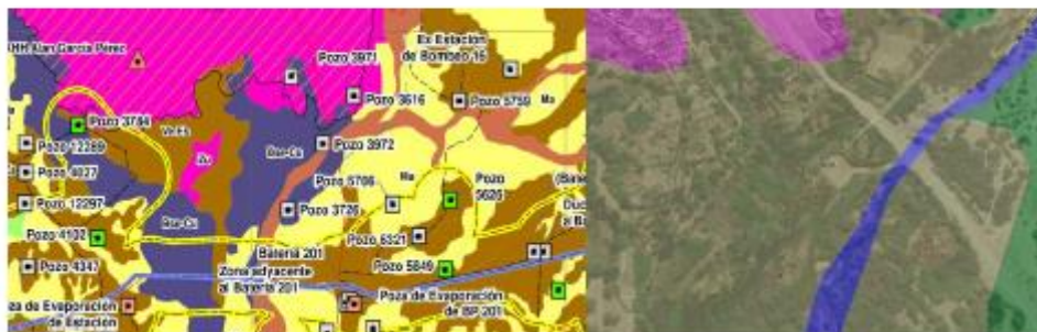
Imagen Nro. 1: "Pozo 3972" ubicado en la Formación vegetal Bosque Seco- Cultivos agrícolas (60-40%).

Segunda Opinión: El Titular precisa las unidades correspondientes a los sitios evaluados en el ítem 3.3. Medio biológico y en el Mapa BG-19820-1-AM-18-Mapa de Muestreo Biológico y Formaciones Vegetales. De acuerdo con lo verificado la observación se considera ABSUELTA .