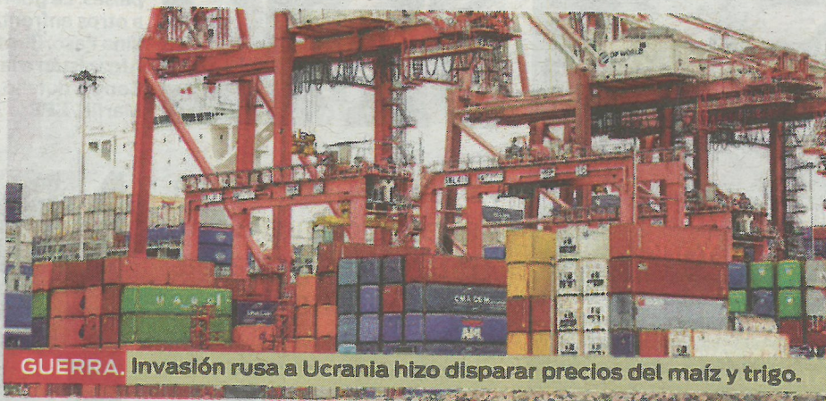
GUERRA. Invasión rusa a Ucrania hizo disparar precios del maíz y trigo.

cial, la diferencia del mayor valor de las exportaciones frente a de las importaciones se redujo en $3 mil millones, considerando que en marzo fue de $16,400 millones, mientras que en junio fue de