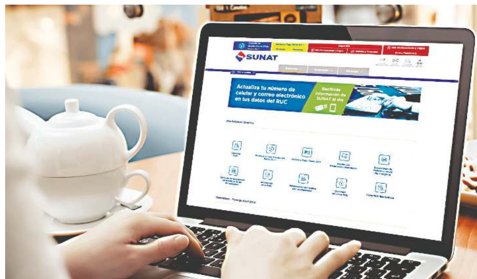
Decisión. Colegiado constitucional evita escenarios de indefensión frente a la autoridad.

que la administración tributaria emplee únicamente el medio de la notificación a casilla electrónica para comunicar este tipo de decisiones tan relevantes al contribuyente, según da cuenta un informe del Estudio Echecopar.