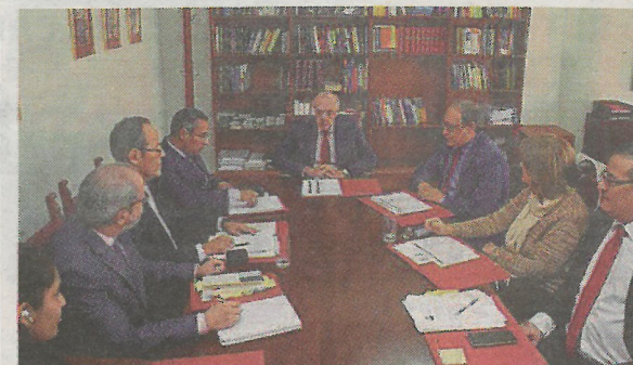
Nuevos magistrados en la ciudad.