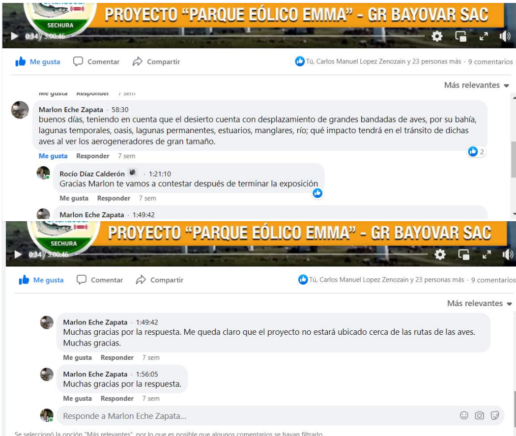
6.- captura de pantalla de la publicación del video del taller participativo en la página web de la consultora ambiental.